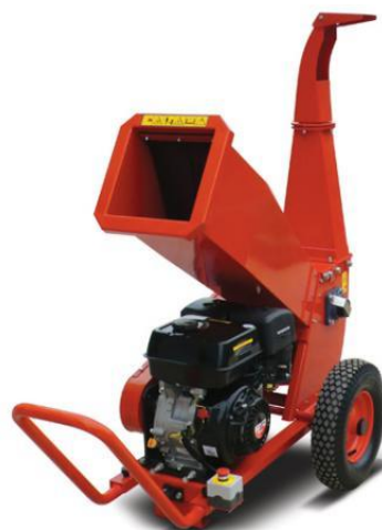
GTM Hakselaar GTS 900

De aanschaf van een nieuwe hakselaar is door de vereniging gedaan zodat er o.a. de berg snoeihout van de fruitbomen mee opgeruimd kan worden en tevens door de tuindienst gebruikt kan worden indien daar aanleiding toe is.